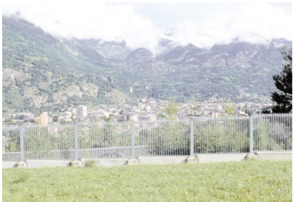
Abb. 1: Übersicht über das Untersuchungsgebiet: Die Schallschutzwand führt zum Teil durch offenes Gelände, zum Teil durch stark mit Hecken, Einzelbüschen und Bäumen durchzogenes Gebiet. Fig. 1: Study area: Transparent walls to minimize noise immissions along motorways lead through open landscape and areas with hedgerows, bushes and trees.

Eine Voruntersuchung mit täglichen Kontrollen wurde vom 15.–30.3.1999 an 150 Scheiben durchgeführt. Jeweils etwa zwei Stunden vor dem Einbruch der Nacht wurde der Abschnitt abgegriffen. Dabei suchten wir beidseits der Scheiben allfällige Kollisionsspuren und Kadaver. Wir haben den Zeitpunkt der Kontrolle, bei Kollisionen die Scheibenummer, die Witterungsbedingungen, die Flugrichtung (Nord/Süd), die Flughöhe (in 3 Klassen: oben, Mitte, unten) und bei Vorhandensein eines Kadavers auch Art, Geschlecht