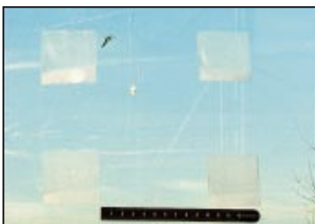
Abb. 3–8: Übersicht über die verwendeten Markierungen (Details siehe Text). Fig. 3–8: Markings tested (details in text).